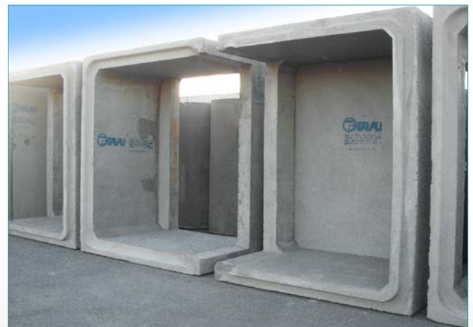
> Marco con esperas para prolongación de muros y recercados in situ en obra.