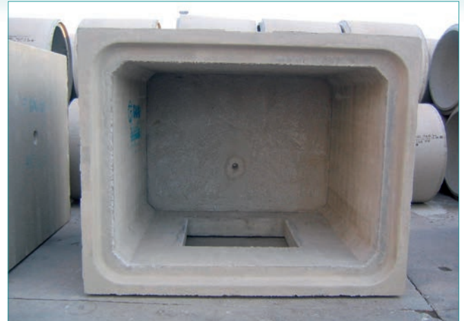
> Marcos con tapa empotrada en inicio o final de alineación.