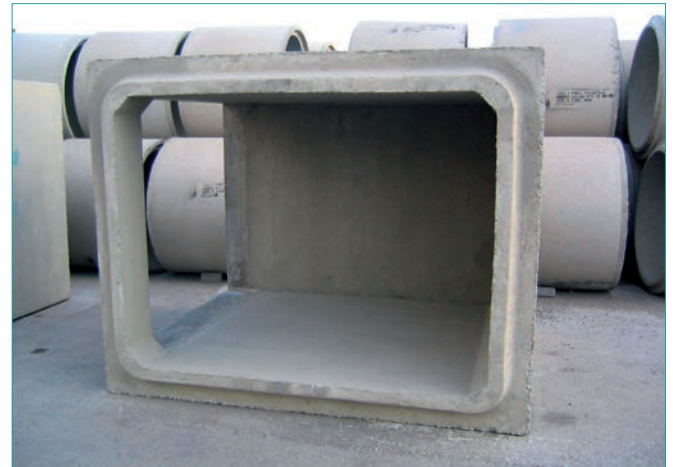
> Piezas especiales para giros de 90°. Conexión testa testa.